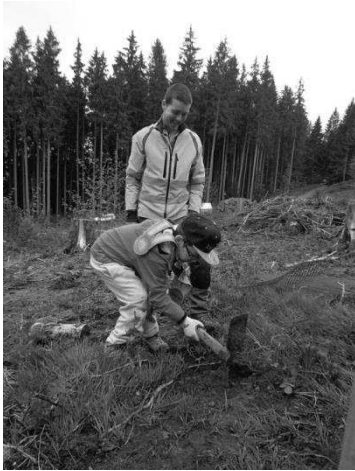
Creuse du trou avant la mise à demeure du plant