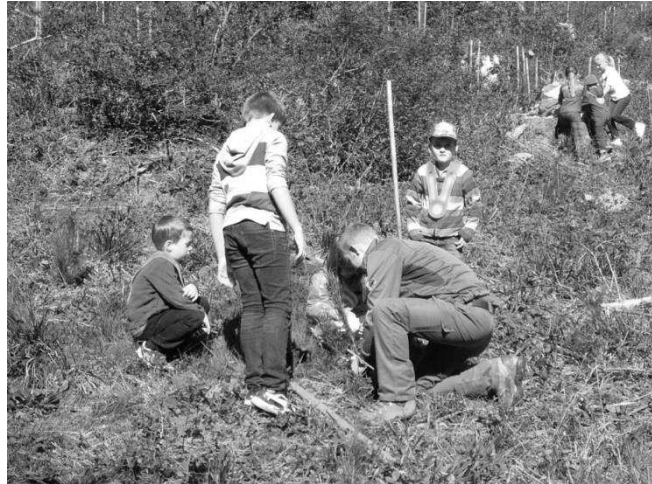
Les travaux de plantation avancent