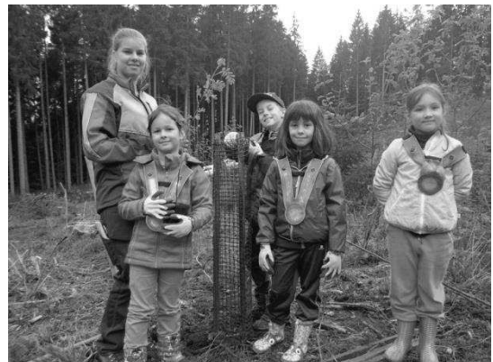
Et voilà le travail terminé