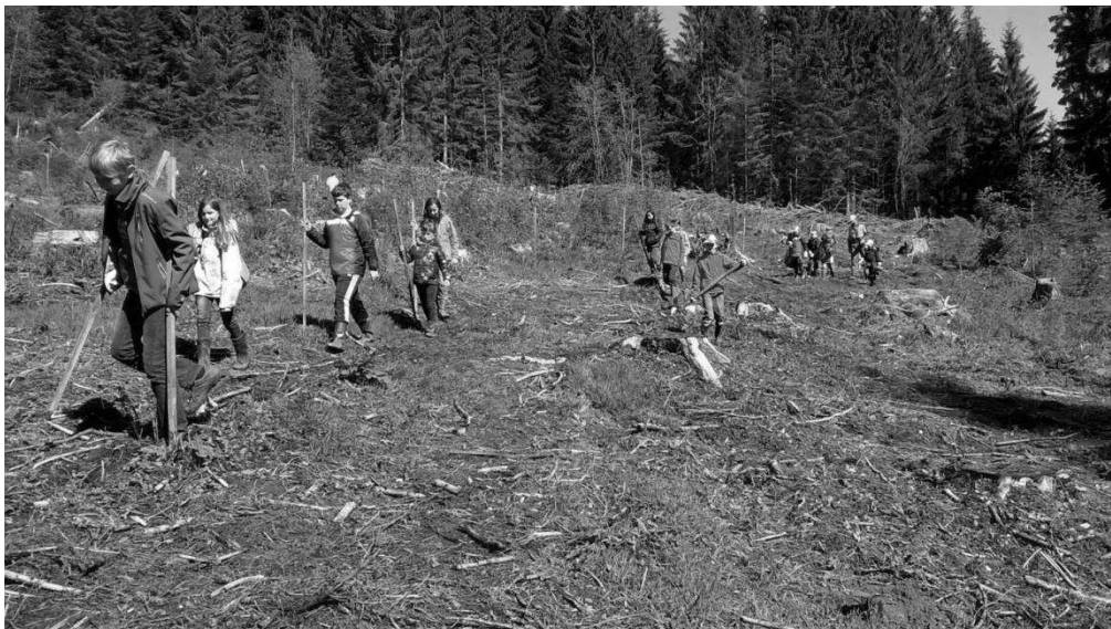
La surface à planter est bien nettoyée et les jeunes sylviculteurs sont motivés