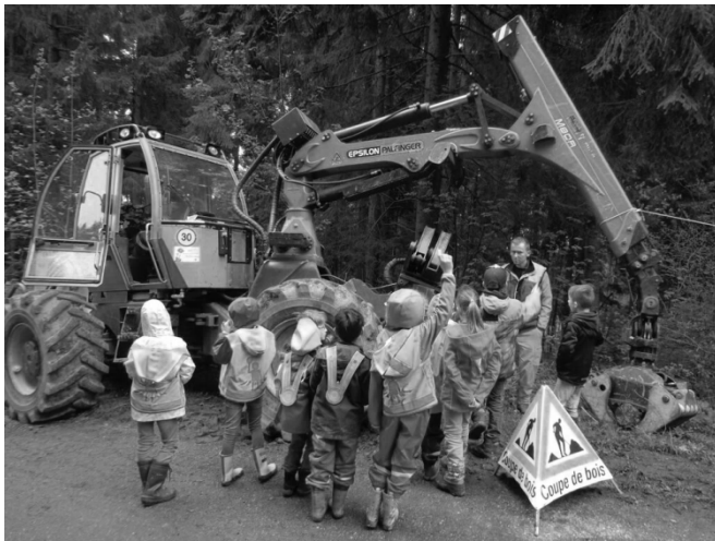
Pour la Corporation forestière du Gibloux Marc Nicolet, forestier 3.1

Mais aussi un petit rappel pour la sécurité de tous, le message de Marc notre forestier-bûcheron : respectez la signalisation des chantiers forestiers.