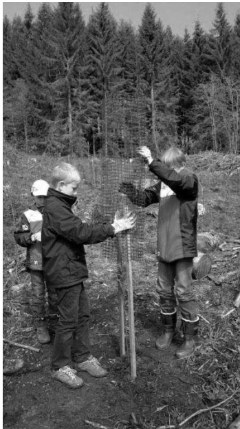
Pose des protections des plants contre les dégâts du chevreuil, abrouissement et frayure