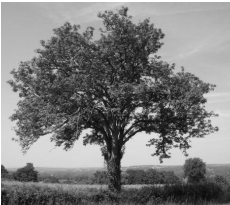
Cormier, Sorbus domestica L

Ainsi chaque élève a planté son arbre, cormier ou pin sylvestre et l'a protégé contre les dégâts dus à la dent du chevreuil. L'équipe de la Corporation forestière Gibloux a eu beaucoup de plaisir à accompagner ces jeunes sylviculteurs dans la réalisation des travaux.